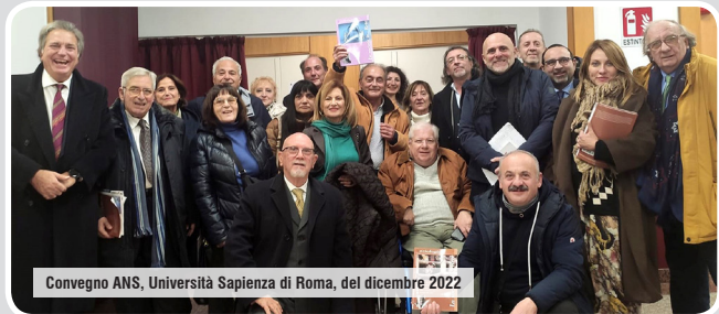
Congresso ANS, Università Sapienza di Roma, del dicembre 2022

Ore 16.30 – 18.00 Assemblea nazionale ANS riservata agli associati regolari.