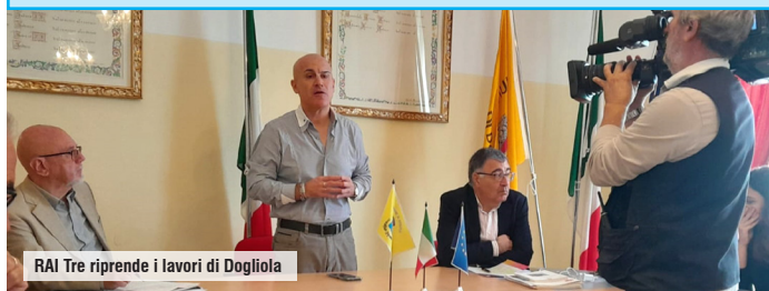
RAI Tre riprende i lavori di Dogliola

Provincia di Chieti, ottobre 2023; il 26 Comune di Castiglione M.M., il 27 Comune di Dogliola, il 28 Comune di San Salvo