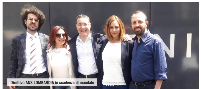
Direttivo ANS LOMBARDIA in scadenza di mandato